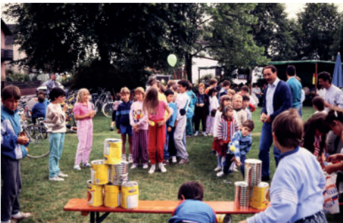
Kinderfeste 1985 bis 2000