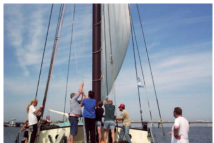
Segeln im IJsselmeer